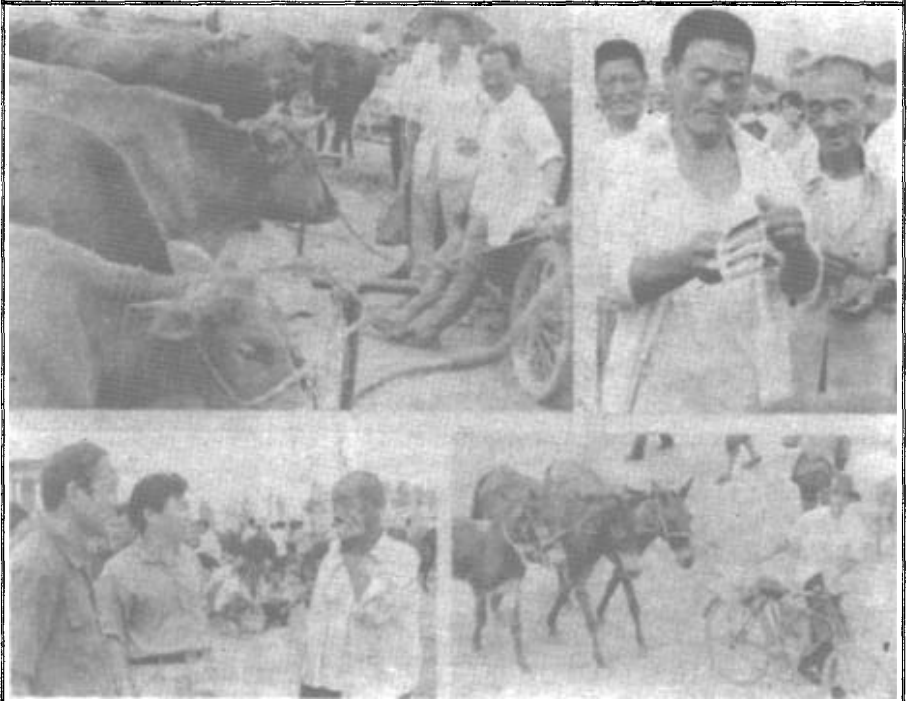
上左：目前该市大牲畜日上市量已达200余头，比1990年提高了3倍多。 上右：一头牛卖了八百九，乐得笑眯眯。 下左：东营区及区工商部门领导经常深入集市征询意见，以便更好地搞好服务。 下右：满载而归。

取措施予以挽救的消息。东营区领导、尤其是区工商局极为重视，会同有关部门，坚决取缔了各种收费，并采取一系列服务措施，使市场逐步得以复苏。最近，记者采访了该市场，耳闻目睹，令人欢喜。